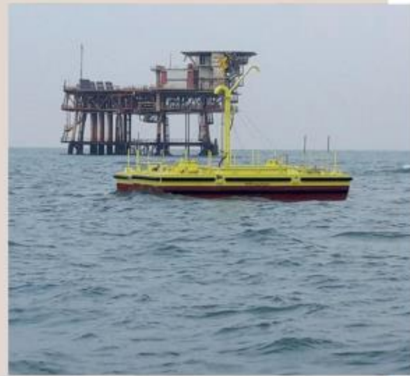
Nella foto, il primo impianto pilota di ISWEC attivo al largo della costa di Ravenna e collegato alla piattaforma PC80 che è arruato a produrre il 105% della sua potenza nominale di 50 kW