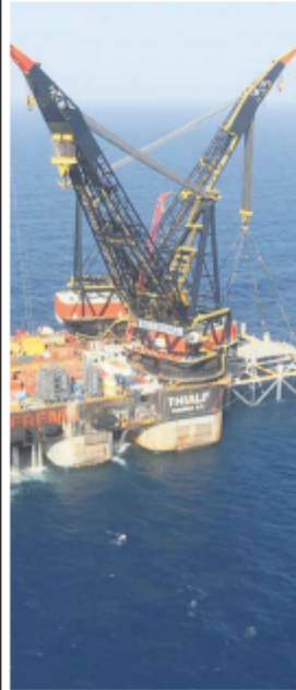
Un impianto di esplorazione per il gas naturale

Fronteggiare gli aumenti dei prezzi sui mercati è impossibile per chiunque. Di più: la crisi con Mosca costringe l'Unione a darsi la zappa sui piedi, minacciando lo stop al nuovo gasdotto Nord Stream 2 che unisce la Russia all'Europa senza passare dai confini ucraini. E così il governo Draghi, fra molti palliativi all'aumento dei costi, ora vuole tornare all'antico, raddoppiando la produzione nazionale di gas ad almeno otto miliardi di metri cubi l'anno. A farsi carico dell'inevitabile è Roberto Cingolani, il ministro voluto e sconosciuto dal mondo Cinque Stelle. Fra i malumori ambientalisti, lo scorso settembre ha imposto ai suoi tecnici l'aggiornamento di un piano sconosciuto ai più: si chiama Piano per la transizione energetica sostenibile delle aree idonee (Ptesai). Dietro l'orribile acronimo e fra 213 pagine di tecnicismi c'è la fotografia di ciò che si può fare o non fare nei mari italiani. L'operazione non è semplice né rapida, ma se avviata può contribuire a far scendere in maniera stabile i prezzi. Oggi giacimenti di gas sono concentrati lungo i mari