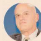
CLAUDIO DESCALZI Il top manager è amministratore delegato del gruppo dal maggio 2014

Quanto agli altri fronti, dividend policy su tutti, il ceo rinvia al prossimo piano, atteso per il 18 marzo, mentre il capex 2022 «sarà in linea più o meno con quello del piano precedente». Infine il capitolo Saipem con l'ad che preferisce non sbilanciarsi: «Con Cdp supportiamo la società ma dobbiamo prima capire il futuro. Fino a quando non conosceremo la nuova riorganizzazione, il nuovo piano e il taglio dei costi non ci possiamo esprimere».