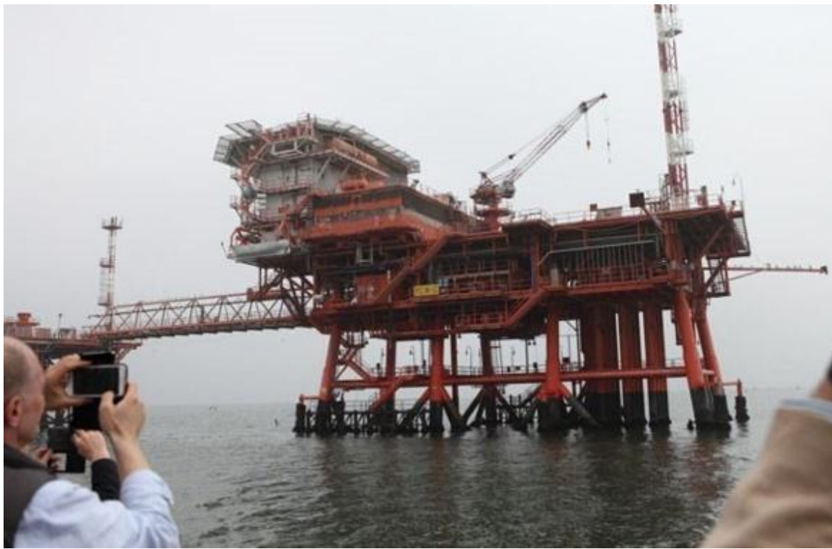
Una piattaforma offshore per l'estrazione di gas dall'Adriatico

«Il prezzo del metano è aumentato perché l'Europa si è fatta trovare con scarse scorte di prodotto nel periodo della ripresa. Questo rafforza la tesi che manca una cabina di regia per l'energia. Viviamo alla giornata. L'Italia in particolare ha vietato le nuove estrazioni dal 2019 in attesa di avere il nuovo piano delle aree il Pitesai. C'è stata una contrazione dei consumi in piena pandemia e noi non solo non abbiamo pensato di fare scorte, ma abbiamo addirittura sospeso la produzione del nostro metano. Quando tutto il mondo ha ripreso le attività naturalmente