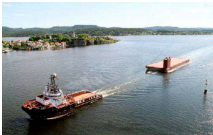
Il rimorchiatore Carlo Magno traina la barge Amt Carrier

sa ravennate aveva acquistato proprio dalla Augustea Maritime Transportation Ltd, specializzata nei trasporti marittimi internazionali di grandi manufatti con convogli propri, il pontone semi-sommergibile "Amt Carrier", costruito nel 2009. La barge, di stazza lorda di 4.500 tonnellate, si era resa necessaria alla Rosetti Marino SpA per traslare a terra - nei capannoni o nei piazzali del proprio Cantiere San Vitale di Ravenna - le unità navali destinate a lavori di trasformazione o di refitting particolarmente lunghi e complessi. Questo enorme manufatto era stato trasportato proprio dal Carlo Martello, che era così tornato nelle acque in cui a-