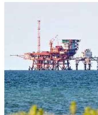
LIDI RAVENNATI Una piattaforma

ziste (ma anche quelle strumentali) di chi non riesce a valutare la portata strategica del comparto per il Sistema-Paese». L'obiettivo è quello di avere pronto un documento con alcune linee strategiche per il 27 marzo, giorno dell'inaugurazione di OMC2019, al quale è stato invitato il sottosegretario alla Presidenza del Consiglio Giancarlo Giorgetti.